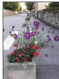
Un fleurissement 100% citoyen