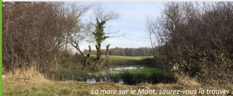
La mare sur le Mont, saurez-vous la trouver ?